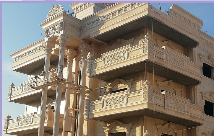
استخدام الأقواس و الأعمدة المجدولة

على عكس الحجر الصناعي المكون من الإسمنت الأبيض والحصىات الناعمة (العدسية) فهي ذات عمر قصير وتمتص الرطوبة والحرارة وجماليتها متوسطة ومقاومتها منخفضة ولذلك لا تستخدمها الشركة في أبنيتها