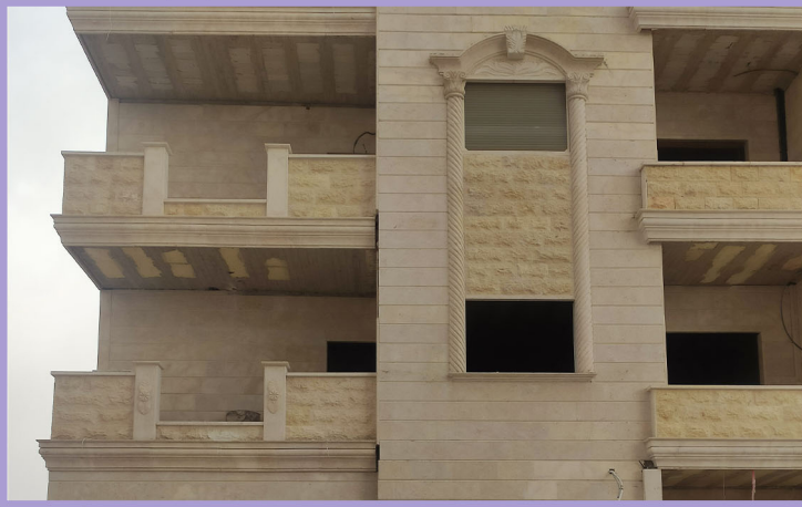
استخدام الحجر الطبيعي في الواجهات

يتم إكساء البناء الخارجي من الحجر الطبيعي الذي يتميز بخاصية العزل (الرطوبة والحرارة) فالحجر الطبيعي هو صخور طبيعية جغرافية تشكلت منذ مئات السنين فهي لا تتأثر بالعوامل الجوية وعمرها طويل وذات جمالية عالية