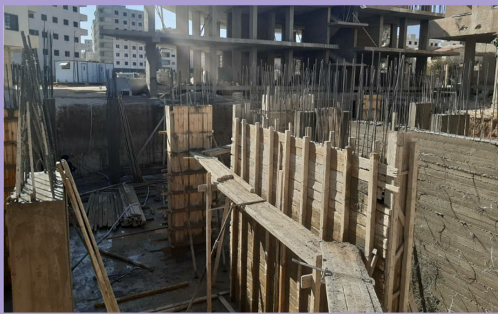
تنفيذ جدران الزلازل والأعمدة

تهتم الشركة بعامل الأمان من خلال استخدامها لأجود أنواع المواد والإلتزام بالكميات الواجب استخدامها في عمليات البناء (عيار الإسمنت ضمن المتر المكعب الواحد المستخدمة في صب القواعد والأعمدة 400 كغ - وعيار الإسمنت المستخدم في صب الأسقف 350 كغ ضمن المتر المكعب الواحد )