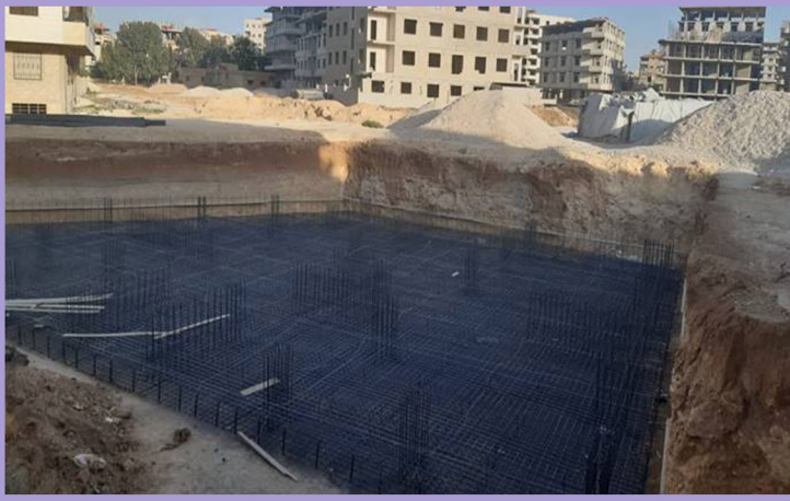
تنفيذ الحصيرة الخرسانية