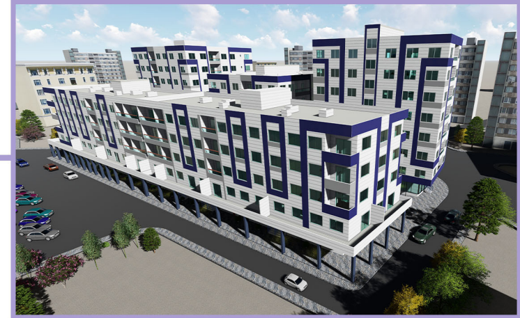
الواجهة الشمالية الغربية