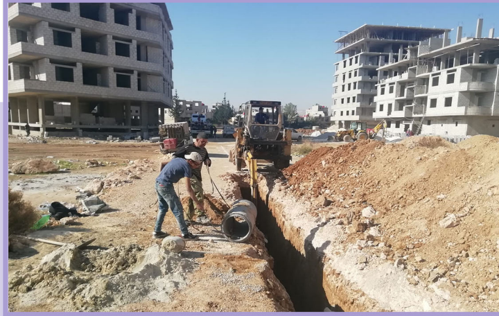
تنفيذ الصرف الصحي

تقوم الشركة بتنفيذ المرافق العامة مثل الصرف الصحي وتعبيد الطرقات وتزفيتھا وتنفيذ الأرصفة والحدائق على نفقتها الخاصة دون الرجوع إلى البلدية في الأمور المادية