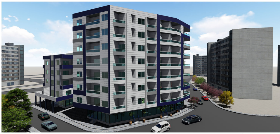
الواجهة الشمالية الشرقية